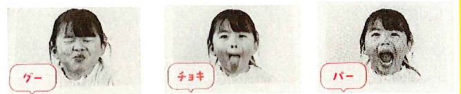
出典:「矯正しないために0さいからできること 歯並びをよくする」杉原麻美著 日本文芸社

※日本歯科医師会ホームページ内の「基本的な歯のみがき方」のコーナーで、『知っておきたい乳歯の歯みがき』と『6歳臼歯をむし歯にしない』の動画(それぞれ5分ほど)が載っています。ぜひ参考にしてください!